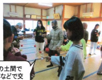
ふれあいの土間で は、昔遊びなどで交 流を深めました