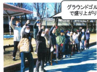
グラウンドゴルフ大会 で盛り上がりました