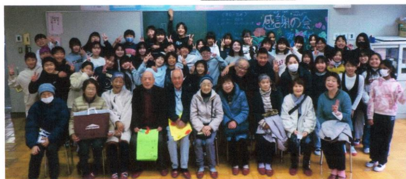
2025年3月4日 感謝の会(桜小にて)