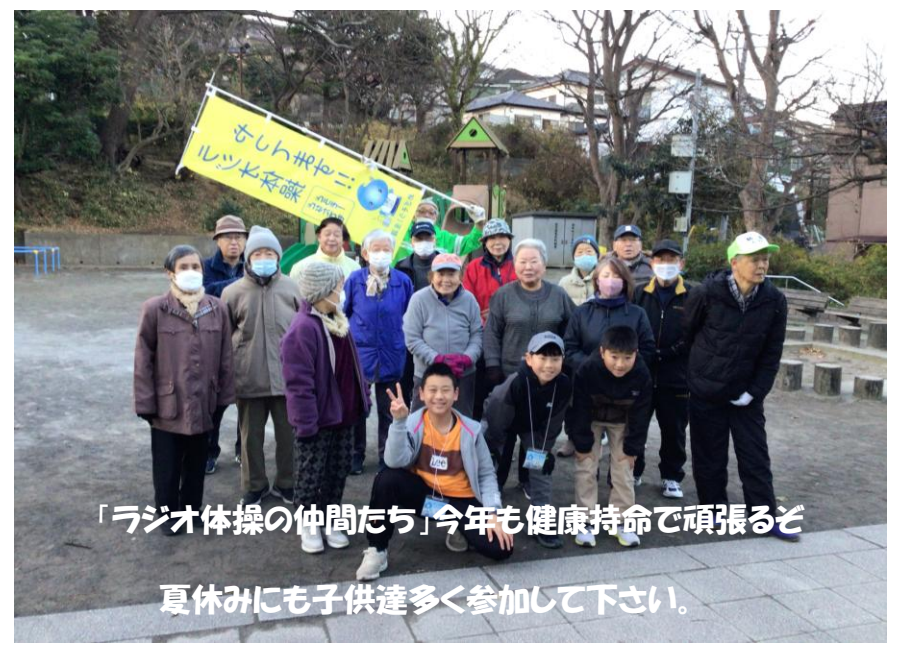
「ラジオ体操の仲間たち」今年も健康持命で頑張ると 夏休みにも子供達多く参加して下さい。