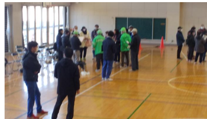
各班別にグループディスカッションの様子 桜小アリーナにて