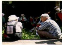
地域の支え合い活動