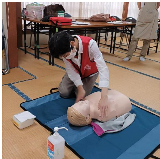
＜大声で助けを（救急車・AEDの手配）＞