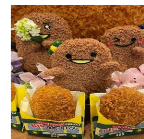
参加持ってまーす！