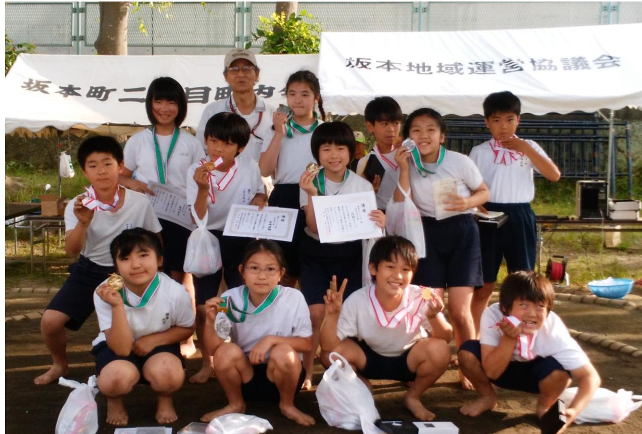
平成30年度 学年チャンピオン戦のメダリスト達。