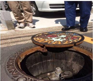
※ 消火栓から5メートル以内は 駐車禁止！気をつけましょう。

☆ 皆様のおかげで無事平成29年度の活動を終えることができました。ありがとうございました。