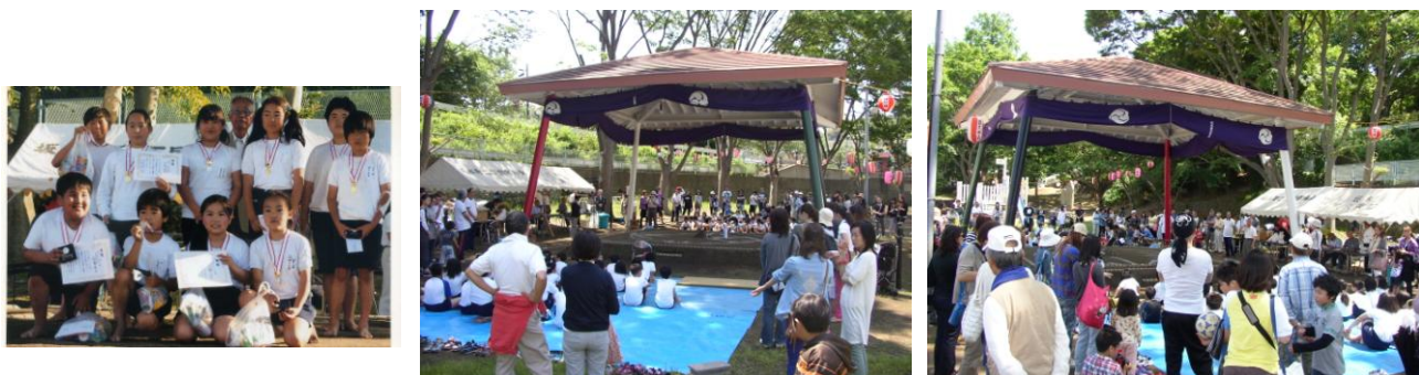
昨年の学年チャンピオンの皆さん