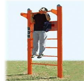
④ ウォールラダー 一番上のバーにぶらさがってのストレッチ効果(腕・背・腰)と、懸垂運動や足を上げて腹筋運動も行えます。