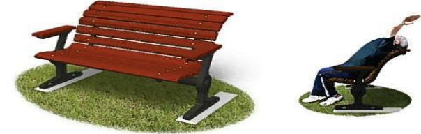
③ リフレッシュベンチ 背もたれを使って背のばし運動ができます。小スペースにも対応するシンプルなモデルです。