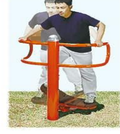
⑥ リズムボード 両足を交互に深く踏み込んでリズム良く体重移動することで大腿部の運動とバランス感覚を養います。