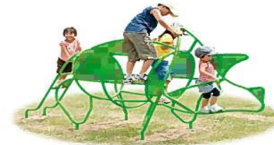
ジャングルジム 恐竜をモチーフにした新しい感覚のかわいいジャングルジムです。