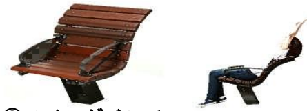
② スイグベンチ 凹形状の断面形状をした背板により、公園で効果的なストレッチ運動が出来る「動くベンチ」です。