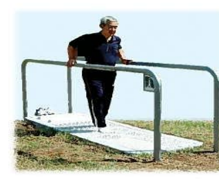
⑤ リラックスボード 靴を脱いだ状態で凹凸の道を歩きます。足裏全体をさまざまな形状の突起でマッサージします。