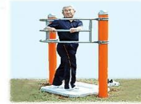
① ツイスト バーを背にして立ち、上半身をひねります。腰のストレッチ効果と同時に足裏を刺激します。