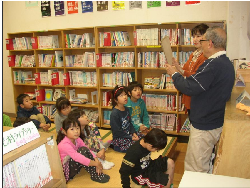
この日は図書室の一角を使って行いました