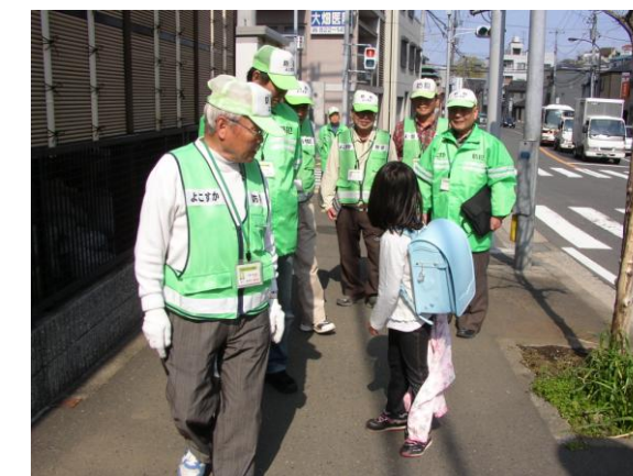
頼もしき親衛隊にエスコートされて