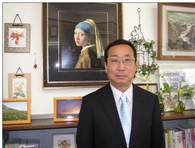
お気に入りのフェルメール 「真珠の耳飾の少女」の前で

まだ赴任して間もないあわただしい時にお話を伺いましたが、坂中生徒の第一印象は良く言えば素直でおとなしい、逆にエネルギッシュな面や積極性があるとさらにいいそうです。早速にも「生徒の挨拶運動」の促進から始めて、地域との防災を含む多面的な連携などご提案を頂きました。落ち着いたら本誌への寄稿もお約束して頂きましたので今後の中学校と地域との連携が楽しみです。