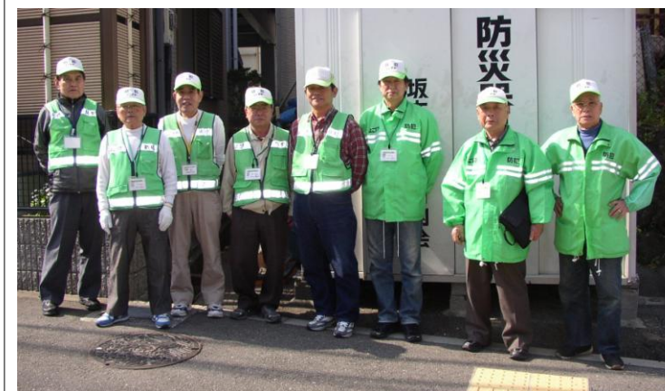
活動拠点待機中のメンバー