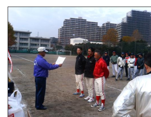
平成18年秋季大会の様子